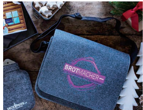
Bequemer Schultergurt und großer Überschlag mit Klettverschluss