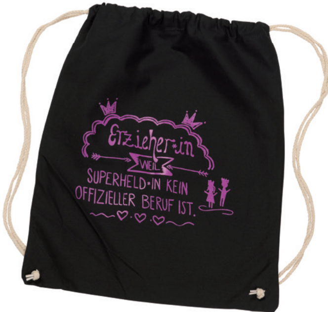
Rucksack-Kordelzugbeutel farbig, 38 x 46 cm, Beispiel Siebdruck einfarbig

Die verschiedenen Rucksack-Kordelzugbeutel aus Baumwolle mit robusten Tragekordeln in Naturfarbe haben ein unschlagbares Preis-Leistungsverhältnis. Sie können immer wieder verwendet werden und schonen somit die Umwelt. Die nachhaltigen Zugbeutel können mittels Siebdruck mit Ihrem Wunschmotiv bedruckt werden und eignen sich ideal als Give-away auf Messen, Festivalbag oder im Alltag.