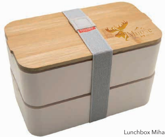
Lunchbox Mihara Beispiel Lasergravur