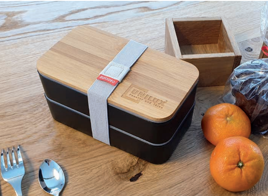
Lunchbox Nagano, Beispiel Lasergravur