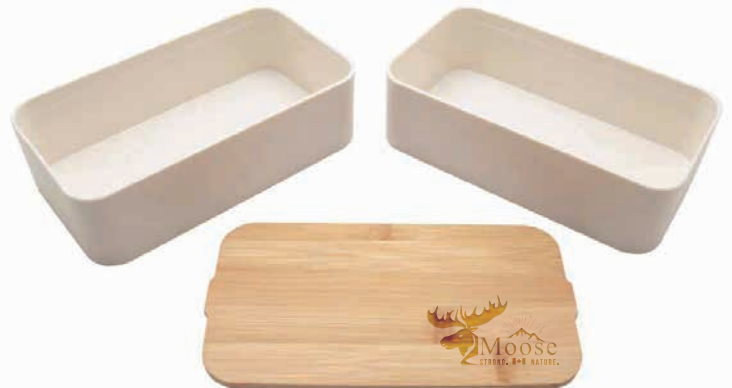
Bambusdeckel kann als Schneidebrett verwendet werden

Lieferzeit: ca. 3 Wochen nach Produktionsfreigabe | Fixtermin? Fragen Sie nach unserem Express-Service! Angebot freibleibend, Preise zzgl. MwSt. ab Werk, Irrtümer vorbehalten. Bitte senden Sie uns Ihre druckfähigen PDF- oder EPS-Daten inklusive Pantone Farbangaben zu.