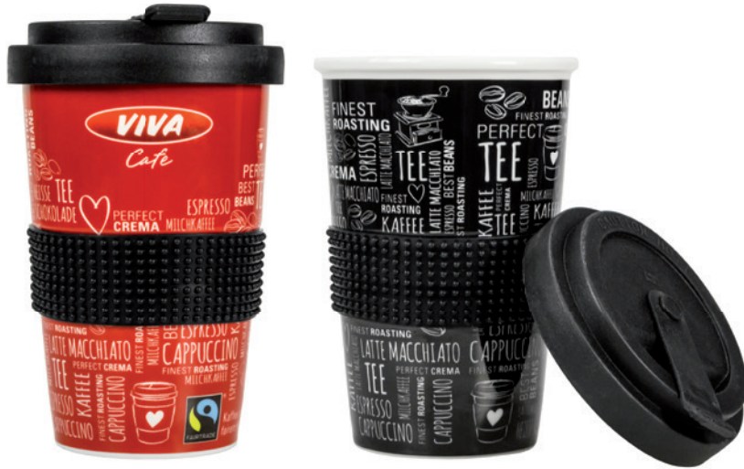
Coffee-TO-GO-Becher ORIGINAL, Beispiel Volldekor, 1-farbig

Coffee-TO-GO, das Original! Die Silikonbänderole schützt vor Hitze. Sie ist in 4 verschiedenen Riffelungen erhältlich. Der bewährte TO-GO-Deckel ist dicht, zeichnet sich durch ein sehr angenehmes Trinkgefühl aus und enthält keine schädlichen Zusatzstoffe. Der Transferdruck im Volldekor oder Teildekor sorgt eine hochwertige Werbeanbringung.