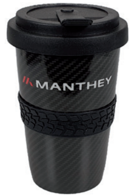
Beispiel Transferdruck Volldekor, schmale Profil-Bänderole