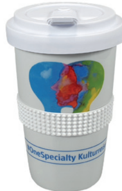
Beispiel Transferdruck Volldekor, schmale Profil-Bänderole