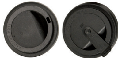
Deckel mit oder ohne Verschluss erhältlich