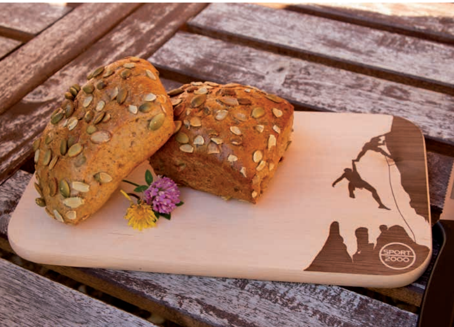
Schneidebrett Erle, unbehandelt, Beispiel Brandstempel

Schneidebrett aus massivem europäischem Erlenholz. Lassen Sie dieses Brettchen mittels Laserschnitt, Lasergravur oder Brandstempel mit Ihrem Logo veredeln. Auch mit Einzelpersonalisierung möglich.