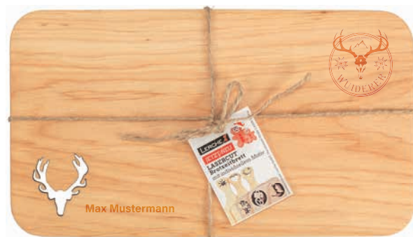
Schneidebrett Erle, geölt, Beispiel Lasergravur, individuell personalisiert