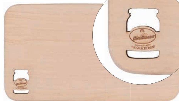
Schneidebrett Erle, unbehandelt, Beispiel Lasercut und Lasergravur