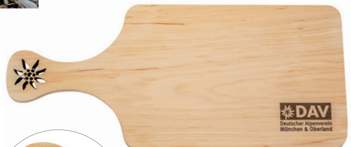
Brotzeitbrett Erle, 32 x 14 cm, geölt, Beispiel Laserschnitt und Lasergravur