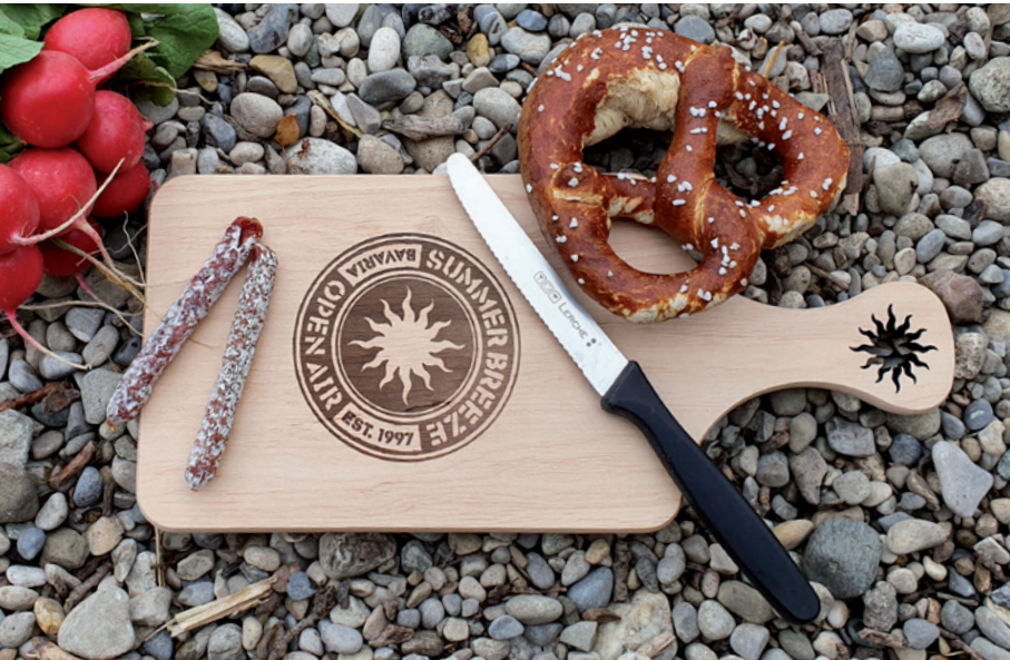
Brotzeitbrett Erle, nicht geölt, Beispiel Laserschnitt und Brandstempel

Artikelnummer: 1835-0401-1005 Material: Erlenholz Größe: 32 x 14 x 1,2 cm Individuelle Maße und weitere Holzarten auf Anfrage Druckart: Brandstempel, Lasergravur, Laserschnitt Werbefläche: max. 60 cm 2 (Lasergravur), 20 cm 2 (Laserschnitt), 20 x 10 cm (200 cm 2 ) (Brandstempel)