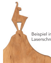
Beispiel individueller Laserschnitt, geölt