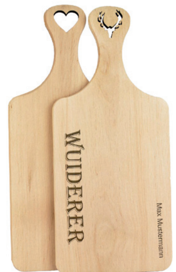
Beispiele Laserschnitt und Brandstempel, individuell personalisierbar gegen Aufpreis

Lieferzeit: ca. 2 Wochen nach Produktionsfreigabe | Fixtermin? Fragen Sie nach unserem Express-Service!