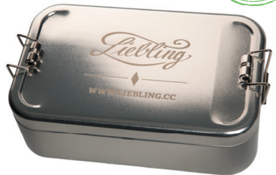
Lunchbox XL mit stabilen Bügelverschlüssen und Lasergravur

Praktische, hochwertige Lunchbox mit lebensmittelechtem Schutzlack im zeitlosen Design aus stabilem Weißblech und gut verschließbarem Stülpdeckel. Zum sicheren Transport von belegten Broten, Obst und Gemüse. Nicht für Geschirrspüler geeignet, wir empfehlen die Reinigung von Hand. Die Lunchbox kann auf dem Blechdeckel mit Lasergravur, Prägung oder Digitaldruck veredelt werden.