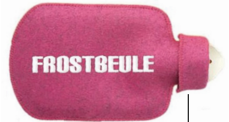
20459 Wärmflasche Molly