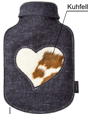
20949 Wärmflasche Herzerl Weitere Motive auf Anfrage

Zick-Zack-Naht als dekorative Ziernaht. Farblich abgesetzter Reißverschluss. Inklusive integrierter Wärmflasche.