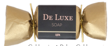
Goldpapier • Deluxe Gold

Maße: Ca. 10,0 x 3,5 x 2,4 cm Gewicht: Ca. 32 g Werbefläche: Ca. 11,8 x 3,8 cm Bitte Standzeichnung anfordern. Druck: Digitaldruck, 4/0-c-Euroskala