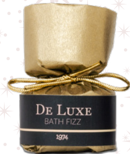
Kraftpapier • Homemade