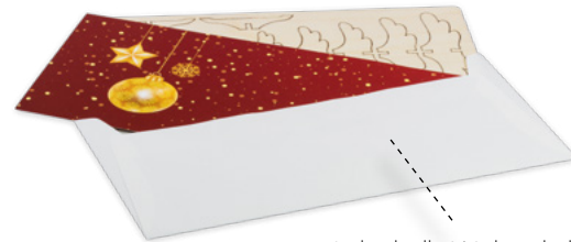
Individuelle Weihnachtskarte und Umschlag

Preise in EUR pro Stück - Inkl. Digitaldruck