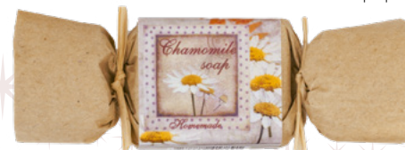
Kraftpapier • Homemade

Preise in EUR pro Stück - Inkl. Digitaldruck