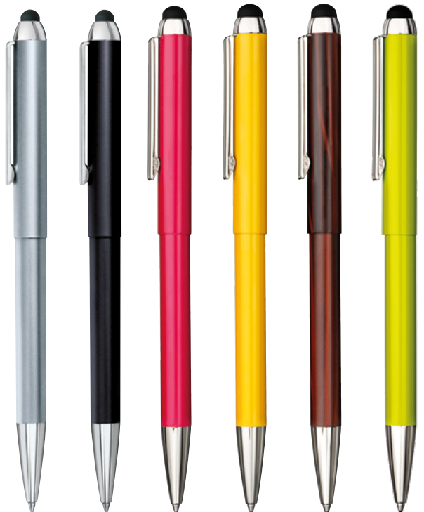
3300M 3302M 3304M 3307M 3308M 3309M