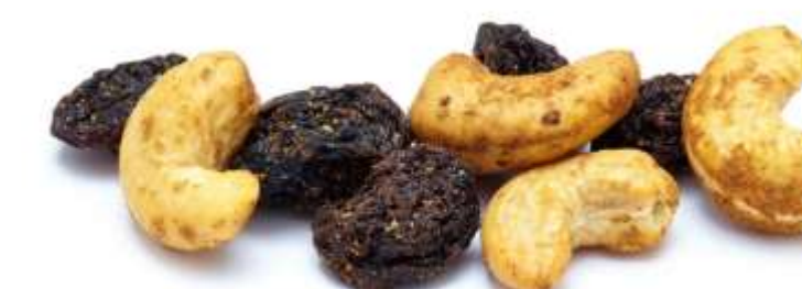
Cashewkerne mit Chili und Weinbeeren (15 g)