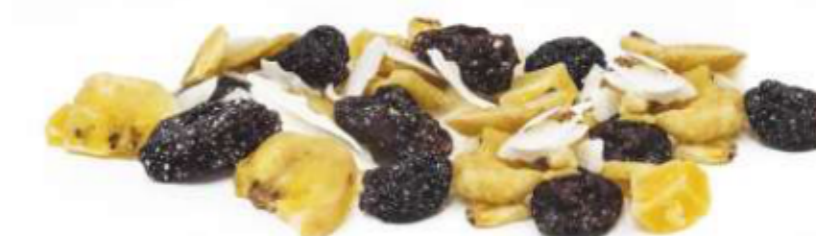
Fruchtmix „Mini Bites“: Mango, Kokos, Banane, Weinbeere (35 g)