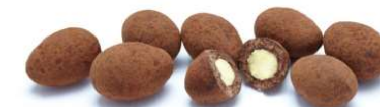
Trüffelmandeln mit Kakao (70 g)