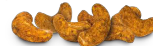
Ofengeröstete Cashews mit Jamaican Jerk oder Montreal BBQ Rub (35 g)