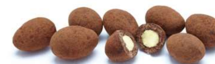
Trüffelmandeln mit Kakao (12 g)

Wählen Sie aus folgenden Snack-Kompositionen