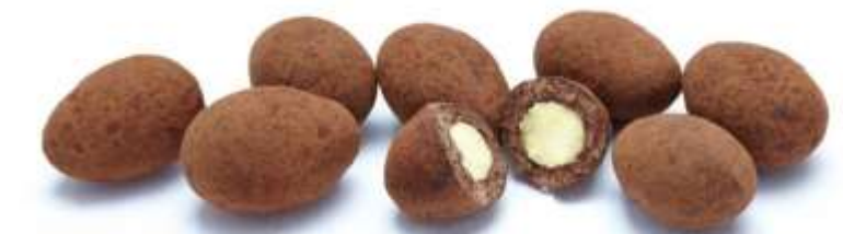
Trüffelmandeln mit Kakao (25 g)