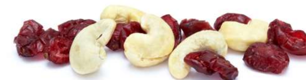
Cranberries und Cashewkerne (12 g)