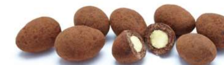
Trüffelmandeln mit Kakao (70 g)