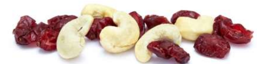
Cashewkerne & Cranberries (25 g)