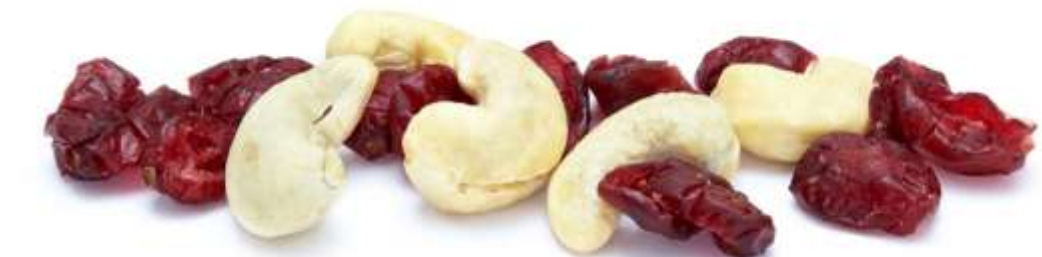
Cranberries und Cashewkerne (12 g)