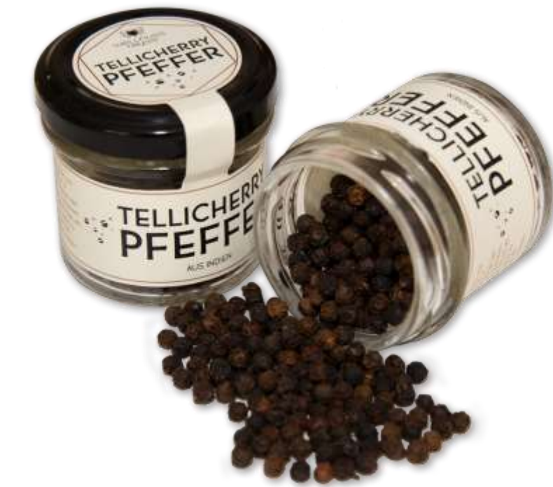
Gourmet Gewürze im Glas