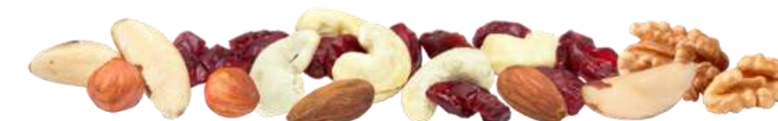
Edelnüsse & Cranberries (70 g)

Wählen Sie aus folgenden Snack-Kompositionen