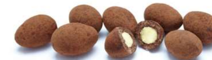
Trüffelmandeln mit Kakao (70 g)